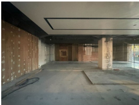
工事前の YAU CENTER

有楽町アートアーバニズム実行委員会 (NPO 法人大丸有エリアマネジメント協会、一般社団法人大手町・丸の内・有楽町地区まちづくり協議会、三菱地所株式会社により組成) は、2022年2月より有楽町アートアーバニズム YAU (以下、YAU) を立ち上げ、まちがアートとともにイノベティブな原動力を生み出すためのパイロットプログラムに取り組んでまいりました。オフィスビルの一画に構える YAU STUDIO を拠点に、ビジネス街において「アーティストがいるまち」を実現してきた YAU は、この度、まちとアートのさらなる接点となるオルタナティブスペース「YAU CENTER」を国際ビル* 1 1階にオープンします。