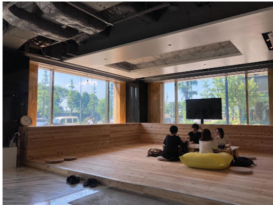
ランチミーティング中の「ゆ〜す相談室」